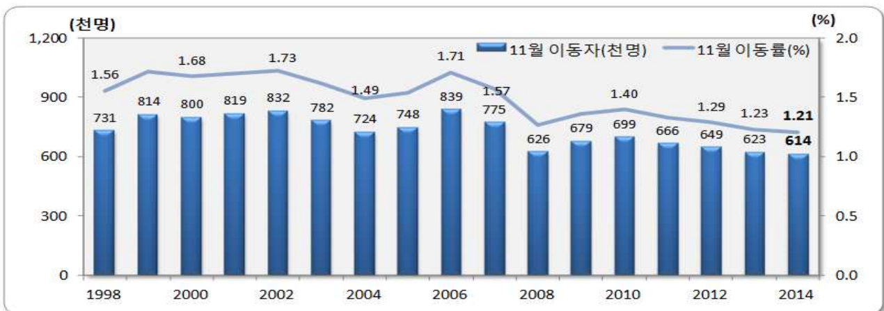
[그림 1] 전국 11월 인구이동 추이